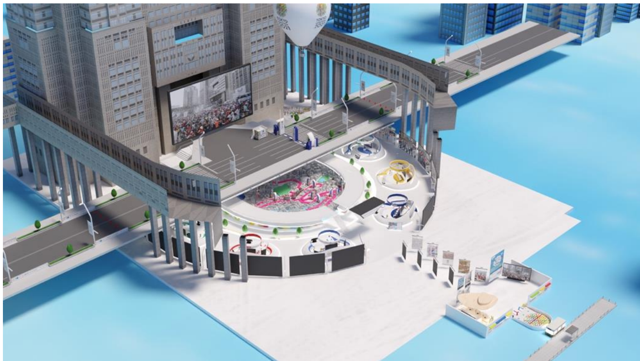
「東京マラソンバーチャル EXPO 2021」会場全体

このたび、TMFが開催する、ニューノーマル時代に対応した新しいランニングショー「東京マラソンバーチャル EXPO 2021」へ、企画運営として参画します。