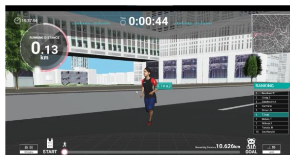
ブース、画面イメージ