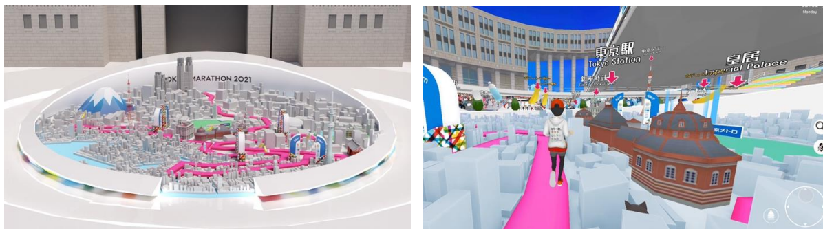
ミニチュアマラソンコースと疑似マラソンの様子

実際の東京マラソンのコース周辺を 3D モデル化。スタートの都庁前から、フィニッシュの東京駅前・行幸通りまでのコース全体やコース上にある給水・給食ポイントなど、実際のコースを再現しています。アバターを介してコースの下見や疑似マラソン体験が楽しめます。