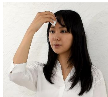
(左)肌測定デバイス。(上半分の蓋を外し、センサー部分を肌につけて測定が可能) (右)肌測定を行っているイメージ