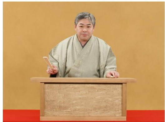
「イオンモール VR×講談」