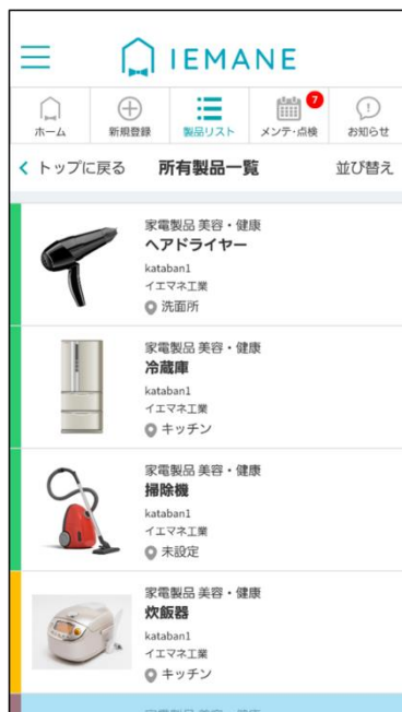
▼所有製品一覧画面