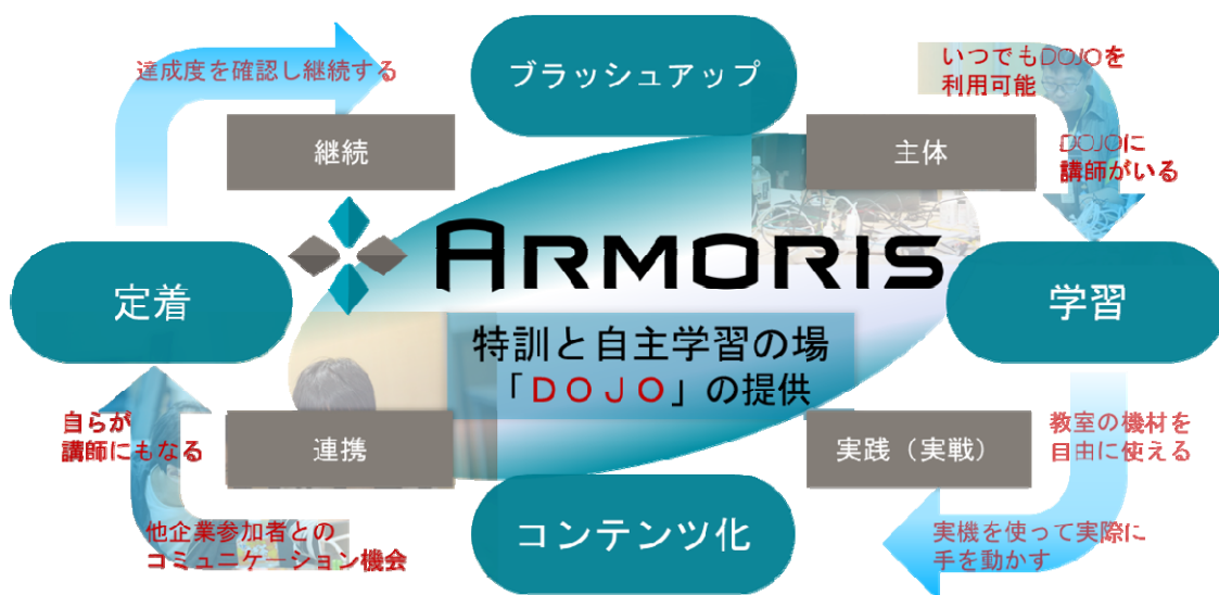
「DOJO」サービスイメージ

Armoris は、本プログラムにとどまらず、常にサイバーセキュリティの最新動向を反映したサービスを提供していくことで、日本における個人と組織のサイバーセキュリティ能力の向上を目指していきます。