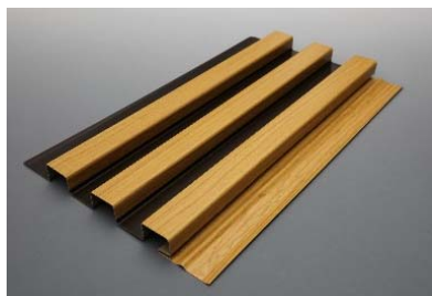
フォルティナ レッジ 「リブ型」