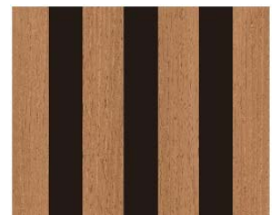
リブ:ADR-758 サーフイルナチュラル