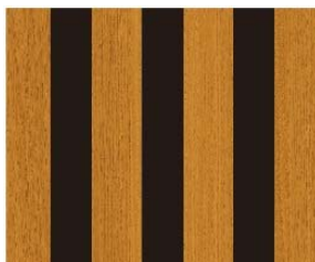
リブ:ADR-005 サーフイルブライトレッド