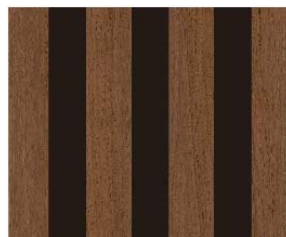
リブ:ADR-647 サーフイルミディアムダーク