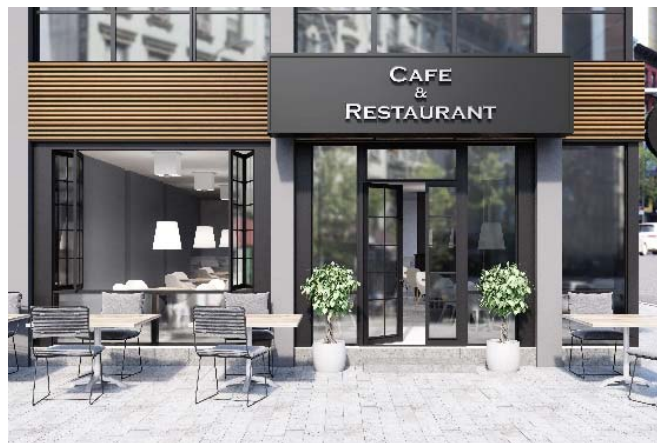
「フォルティナ レッジ 「リブ型」 施工イメージ

なお本製品は、2019年3月5日(火)から8日(金)まで開催される店舗総合見本市「JAPAN SHOP 2019」(会場:東京ビッグサイト)の凸版印刷ブース(東4ホール・小間番号:JS4406)にて展示します。