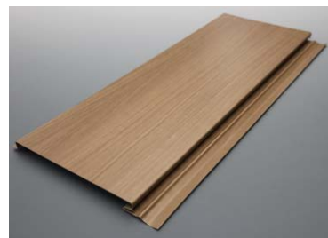
フォルティナ レッジ 「フラット型」