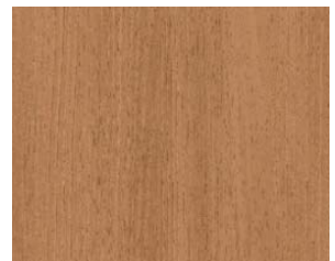
フラット:ADF-758 サーフイルナチュラル