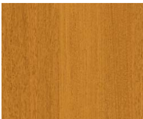
フラット:ADF-005 サーフイルブライトレッド