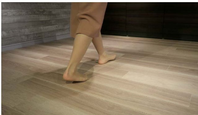
「ロケーションフロア」利用イメージ

なお、「トッパン IoT 建材」は、2018年11月20日(火)から22日(木)まで凸版印刷が東京にて開催するイベント「フォレストフェア 2018 秋」にて紹介します。