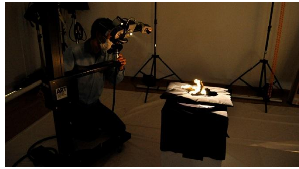
(右) 国宝「合掌土偶」立体形状計測風景(協力: 八戸市埋蔵文化財センター是川縄文館)