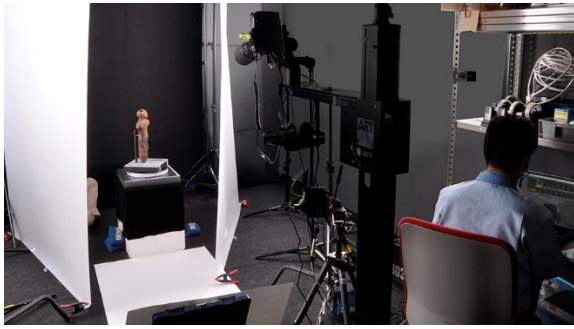
(左) 国宝「中空土偶」高精細デジタル撮影風景(協力: 函館市縄文文化交流センター)