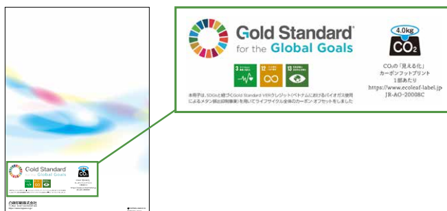
トッパン「統合レポート2020(和文)」 (印刷冊子裏表紙)

https://ecoleaf-label.jp/pdf_view.php?uuid=c2743b52-521c-469b-a28b-3c698f0311ea.pdf&filename=JR-AO-20008C_JPN.pdf